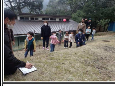
大蛇の国では、的当てに挑戦しました。上手く当てられるかな！