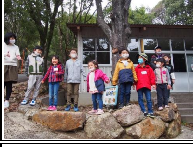
ハーモニーの国では、みんなで歌を歌いました。