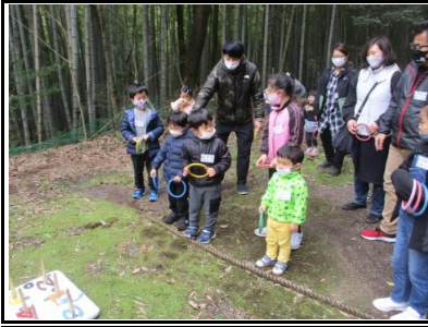
カウボーイの国では、輪投げにチャレンジしました。