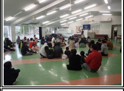
わんぱく大冒険後、夕べのどいをしました。