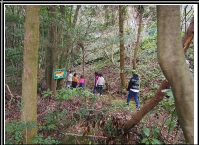
かくれんぼの国では、通路に隠された10体の動物を見つけながら進みました。