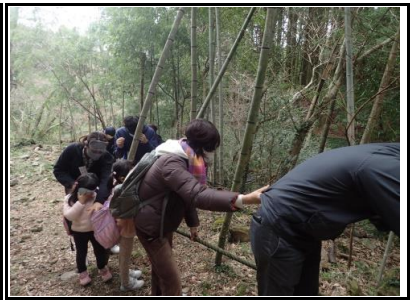
暗黒の国では、親子で暗闇を体験しました。