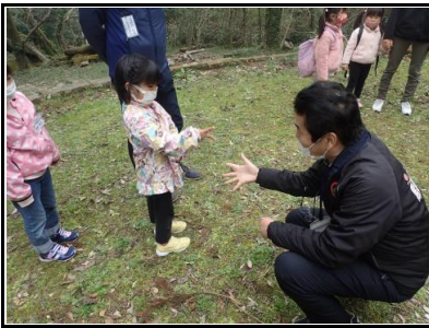
第2営火場では、ジャンケンゲームをしました。所長に勝てるかな！