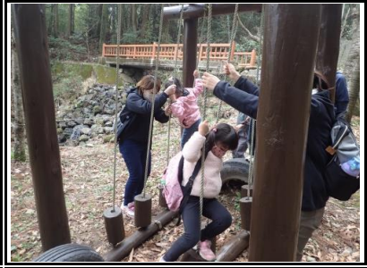
わんぱくの国では、アスレチックに挑戦しました。