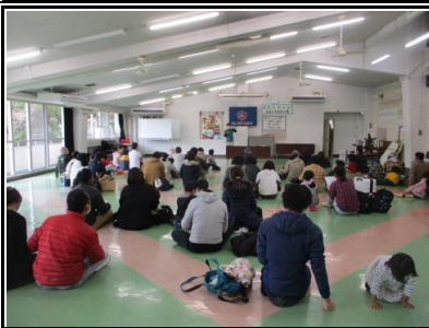
開会式後は、わんぱく大冒険ういぼうコースに出発しました。