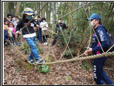
つり橋の国では、ロープを綱渡りして渡りました。