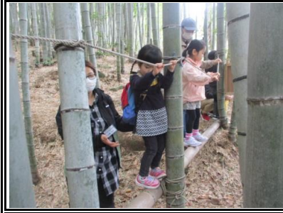
忍者の国では、竹橋の上を進みました。小さい子も、親御さんのサポートで渡っていました。