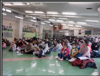
今回は、沢山のご家族が親子わくわく楽習セミナーに参加していただきました。