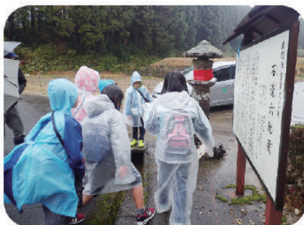
(所要時間)3時間程度