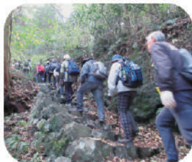
(所要時間) 黒髪山：約5時間

豊富な植物と野鳥が 生息する黒髪山系の 自然を楽しみながら 歩く楽しいコースです！