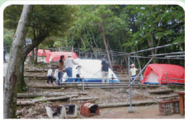
テント完備/最大150名収容可