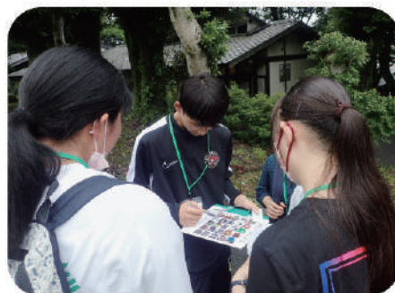
(所要時間)2～3時間程度