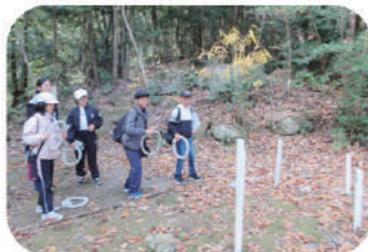
うりぼうコース(幼児・小学年向け)