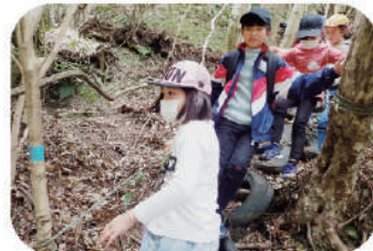
西コース (小学校高学年・中学生向け) ※現在使用不可