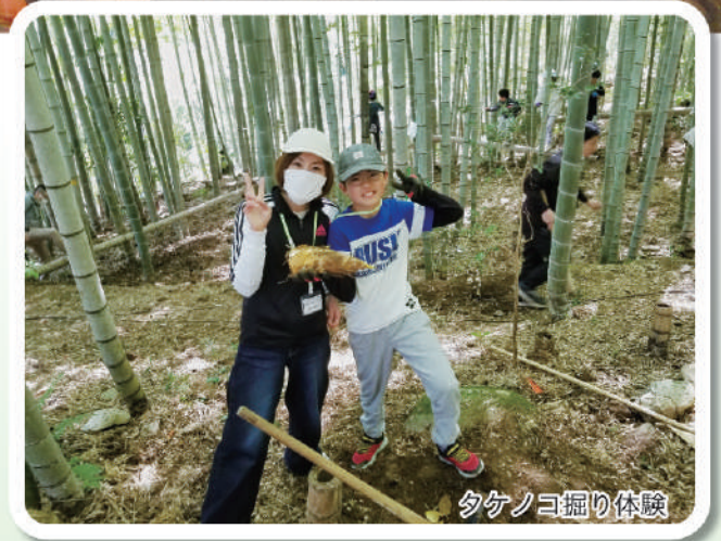
タケノコ掘り体験