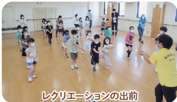
レクリエーションの出前

黒髪少年自然の家の活動プログラムを皆さんのももて提供しています。 令和5年度は34団体2,196名の方にご利用いただきました。 令和6年度も引き続き行いますので、ぜひご利用ください。 詳しくは当所にお問合せください。