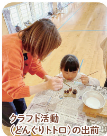
クラフト活動 (どんぐりトトロ)の出前