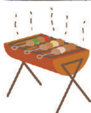
(所要時間) 4～5時間程度