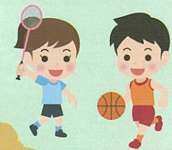
屋内スポーツやレクリエーション等、雨天時トレーニングに利用できます。