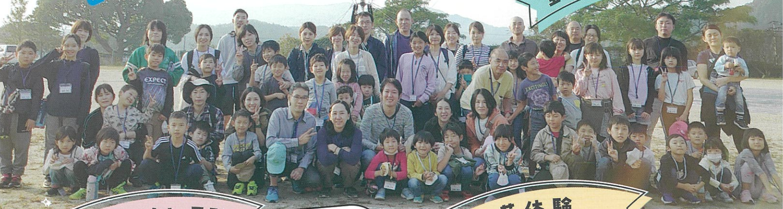
年末フェスタin黒髪