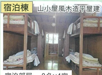
宿泊部屋 8名×4室 リーダー室 4名×1室 4棟のみリーダー室 8名