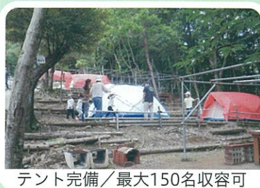
テント完備/最大150名収容可